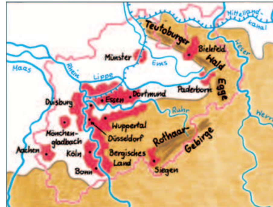
2 Gebirgszüge, Städte und Namen

3. Schritt: Wähle für das Bergland einen braunen Farbstift. Damit zeichnest du die Bereiche der Mittelgebirge ein. Hebe wichtige Gebirgszüge mit kräftigerem Braun hervor.