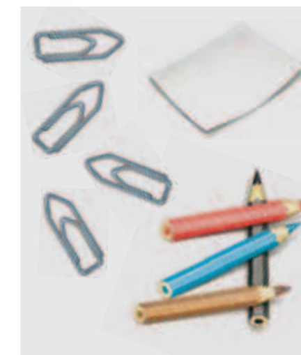
3 Was du für eine Kartenskizze brauchst

5. Schritt: Zuletzt beschriftest du deine „stumme“ Karte. Für Städte, Gebirge und Landschaften nimmst du einen schwarzen Stift und für die Flussnamen einen blauen Stift.