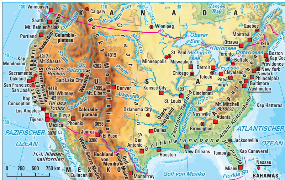
1 Vereinigte Staaten von Amerika – physische Übersicht

Die geographische Lage von Orten, Regionen, Gebirgen oder anderen Objekten wird oft in einer vereinfachten Zeichnung – einer kartographischen Skizze – dargestellt. Mit dieser ist es dann möglich, Lagemerkmale geographischer Objekte zu beschreiben, Lagebeziehungen herzustellen sowie Abgrenzungen zu verdeutlichen. Neben solchen Lageskizzen helfen oft auch einfache thematische Karten, um räumliche Verteilungen von bestimmten geographischen Merkmalen darzustellen.