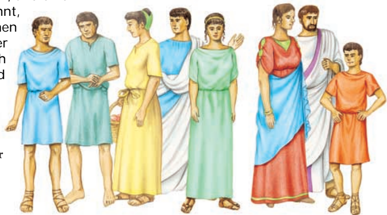
Römerinnen und Römer

Vielleicht könnt ihr die verschiedenen Kleidungsstücke in einer kleinen Modenschau vorführen, z.B. auf einem Schulfest. Überlegt euch zu jedem Gewand einen kurzen Kommentar und stellt die Modelle den Zuschauern vor.