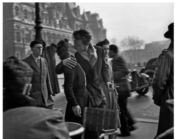
e | Robert Doisneau: Kuss vor dem Hôtel de Ville Paris, 1950, Fotografie, 30,48 x 25,40 cm, Originalabzug im Privatbesitz