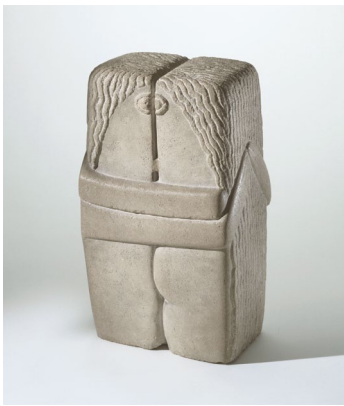
a | Constantin Brancusi: Der Kuss, 1916, Kalkstein, 58,4 x 33,7 x 25,4 cm, The Louise and Walter Arensberg Collection, Philadelphia Museum of Art

Fünfmal wird geküsst – innig und leidenschaftlich! Die Art und Weise jedoch, ein sich küssendes Liebespaar künstlerisch darzustellen, ist in den folgenden fünf Werkbeispielen verschieden. Finde die Unterschiede – aber auch die Übereinstimmungen dieser motivgleichen Kunstwerke heraus. Die Liste auf der nächsten Seite hilft dir bei dem Werkvergleich der dargestellten Liebespaare. Fülle die Liste aus. Du kannst sie auch noch erweitern.