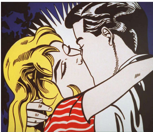
d | Roy Lichtenstein: Kiss II, ca. 1962, Öl auf Leinwand, 145 x 172 cm, Privatbesitz