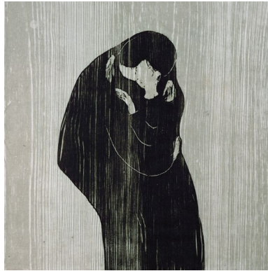
b | Edvard Munch: Der Kuss, 1902, 1. Fassung 1897, Holzschnitt, 46,6 x 47,4 cm, Munch Museet, Oslo